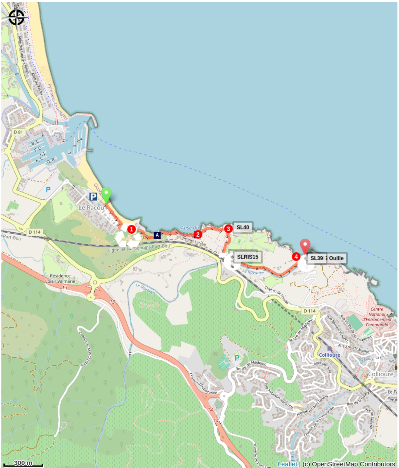
Les Criques de Portails (A)