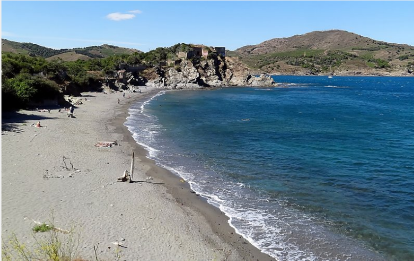
Plage du fourat (CCACVI)