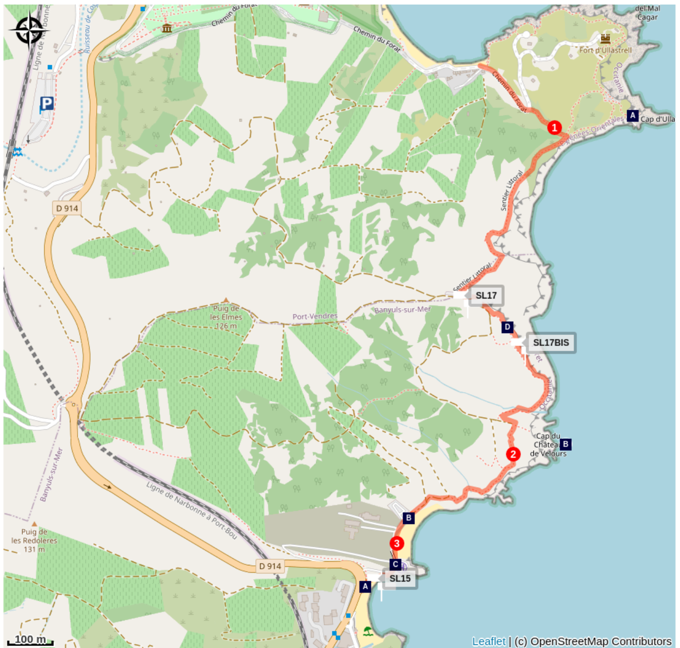
Cap d'Ullastrell (A)