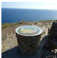
Table d'orientation du Cap R d ris (A)

Profitez de ce point de vue panoramique pour observer le paysage.