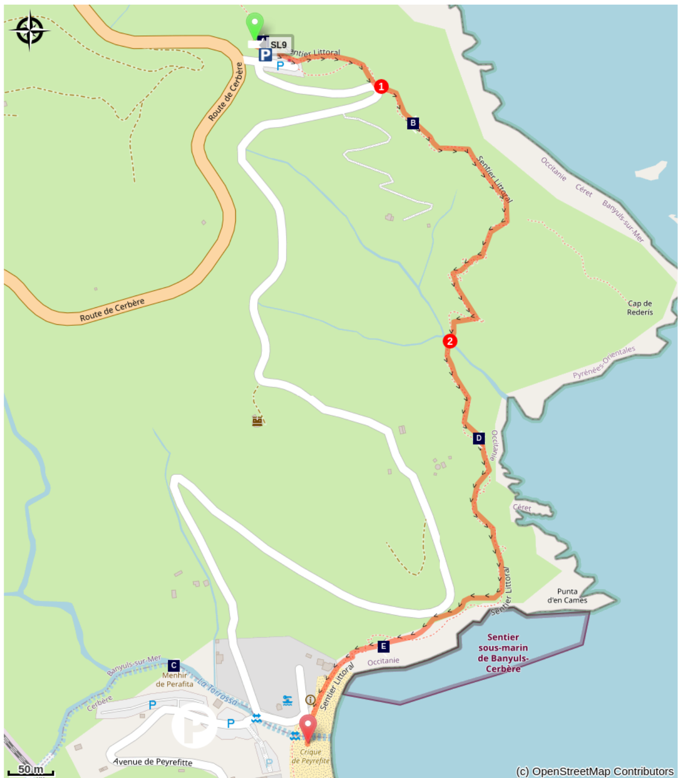
Table d'orientation du Cap Rédérès (A) La Pedra Dreta (La Peyrafita) (C) Point de vue (E)