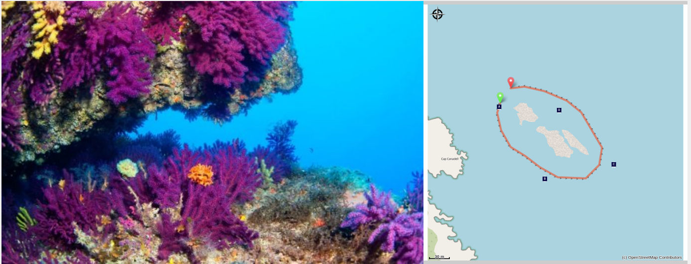
Cap Canadell (Cap Cerbère)