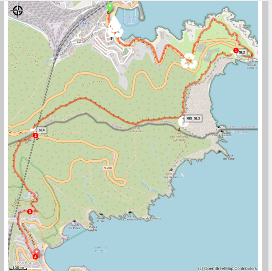
Frontière (OT Llançà)