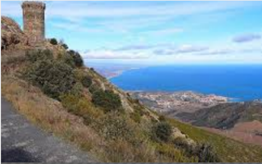
Tour Madeloc (elcoste)