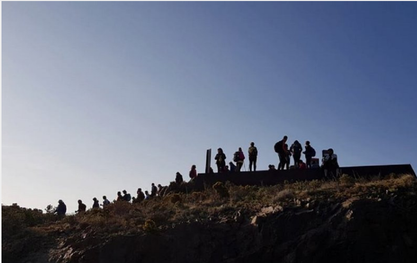
Frontière (OT Llançà)