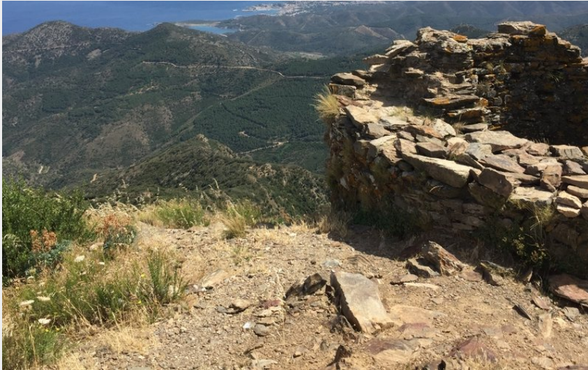
Tour de Querroig (CCACVI)