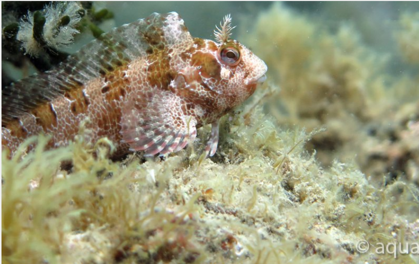
Blennie (Aquatile plongée)