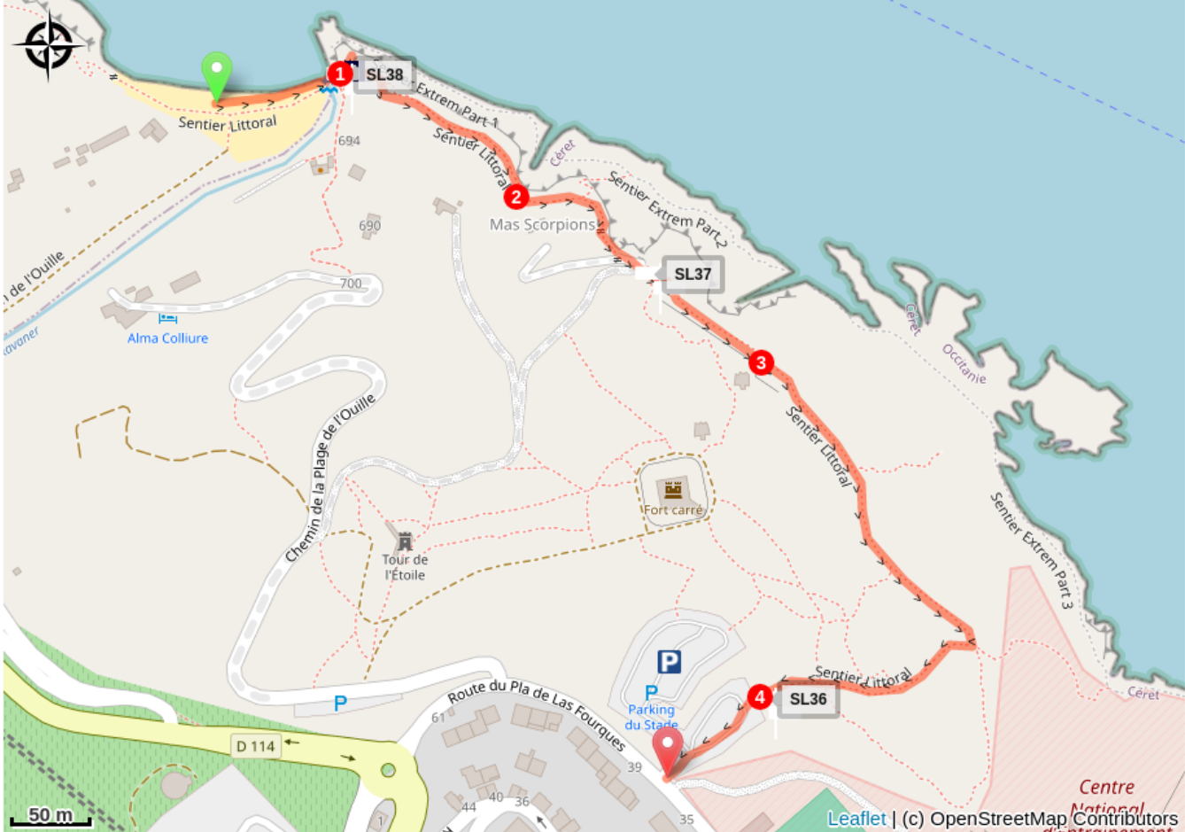
La Playa de Ouille (A)