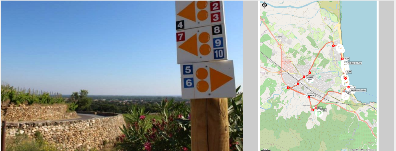
Signalétique VTT (Mairie D'Argelès-sur-Mer)