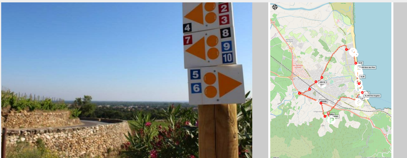
Signalétique VTT (Mairie D'Argelès-sur-Mer)