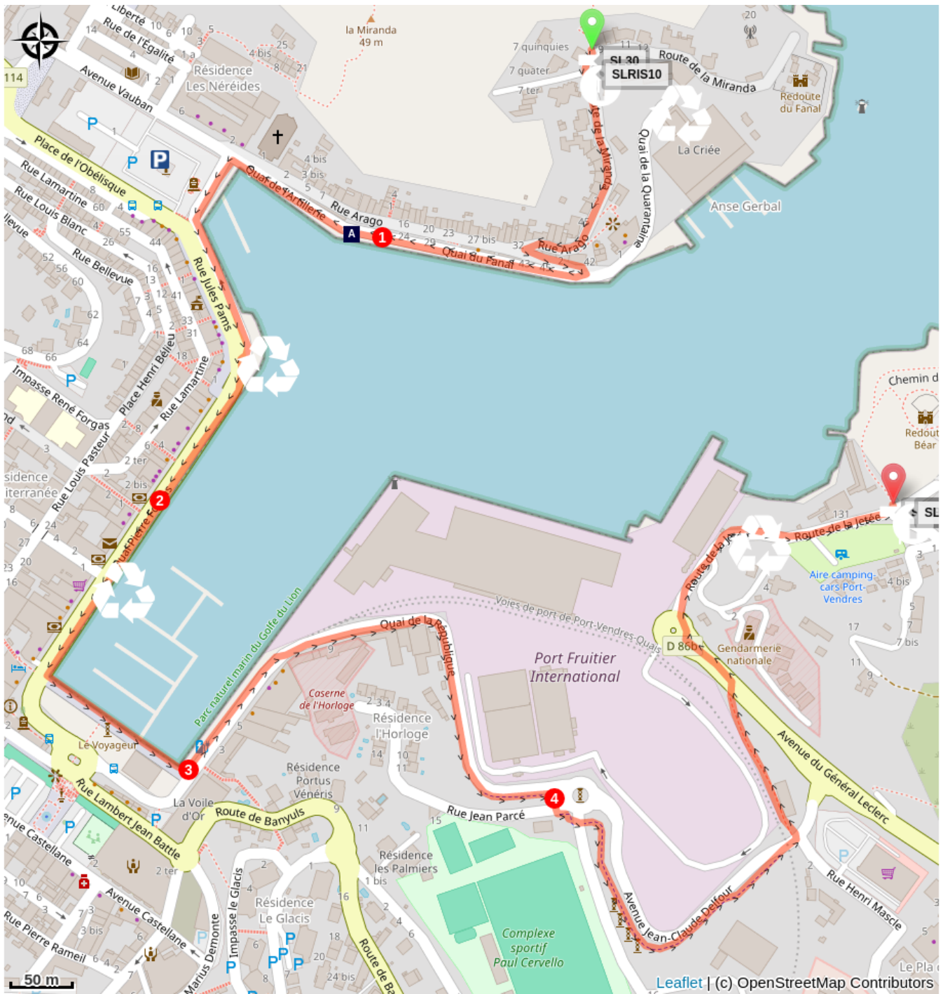
Nostra Mar (A)