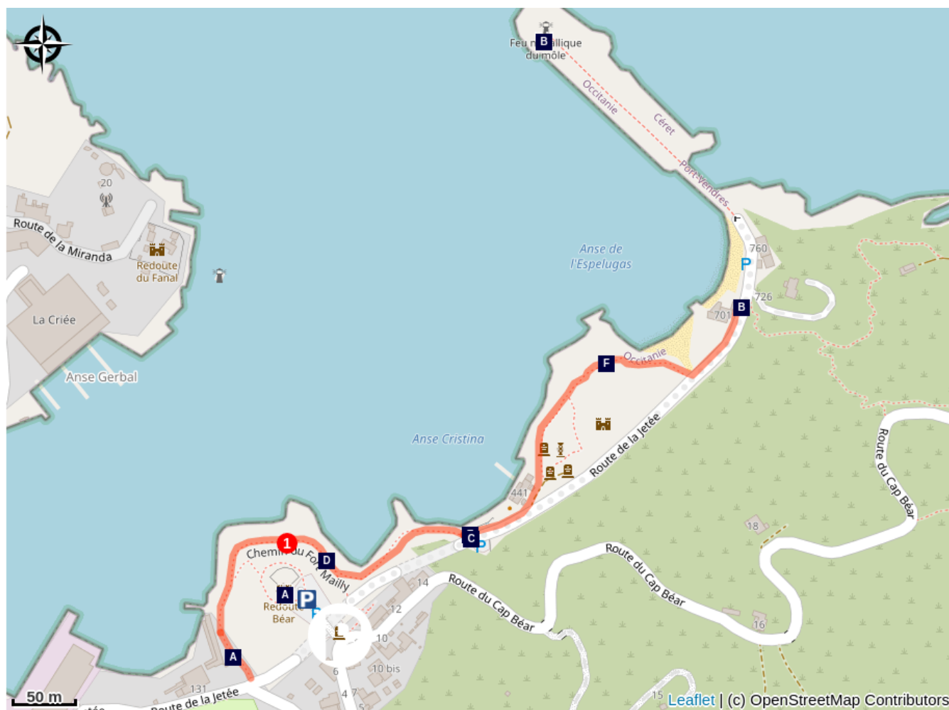
Redoute Béar (A)