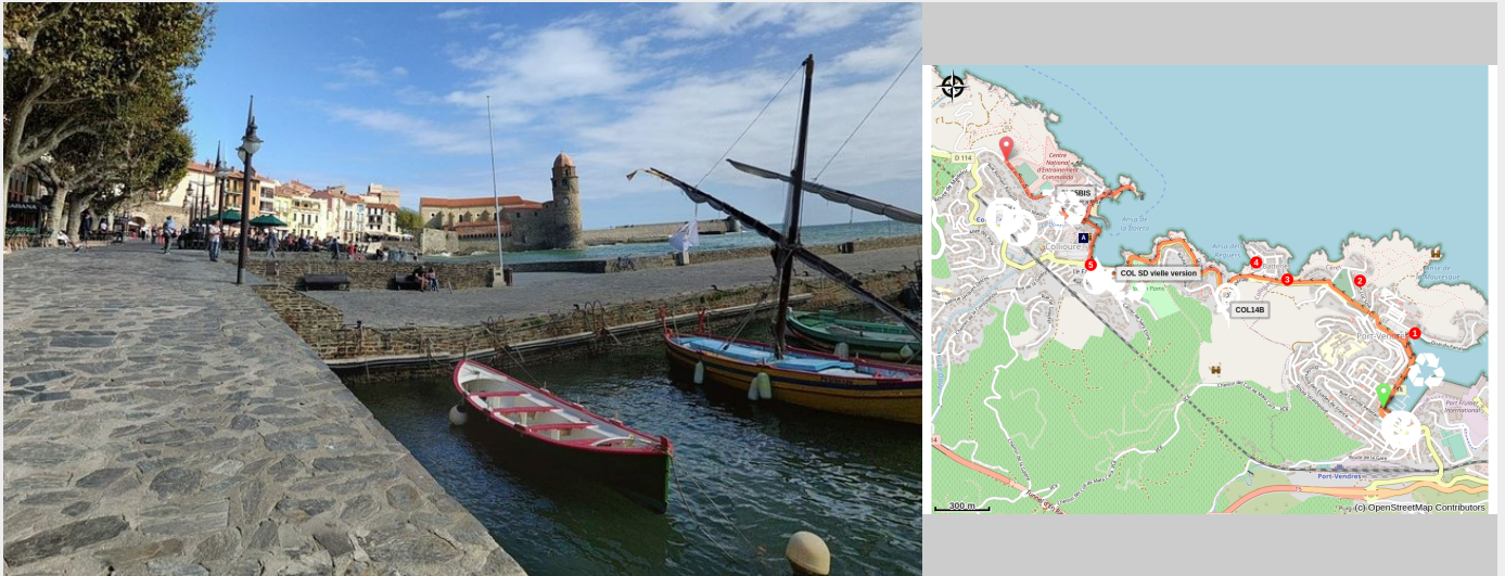
Collioure (Valery Zavidovich)