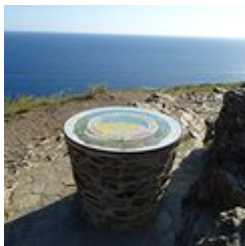
Table d'orientation du Cap Rédéris (A)

Disfruta de este mirador panorámico para observar el paisaje.