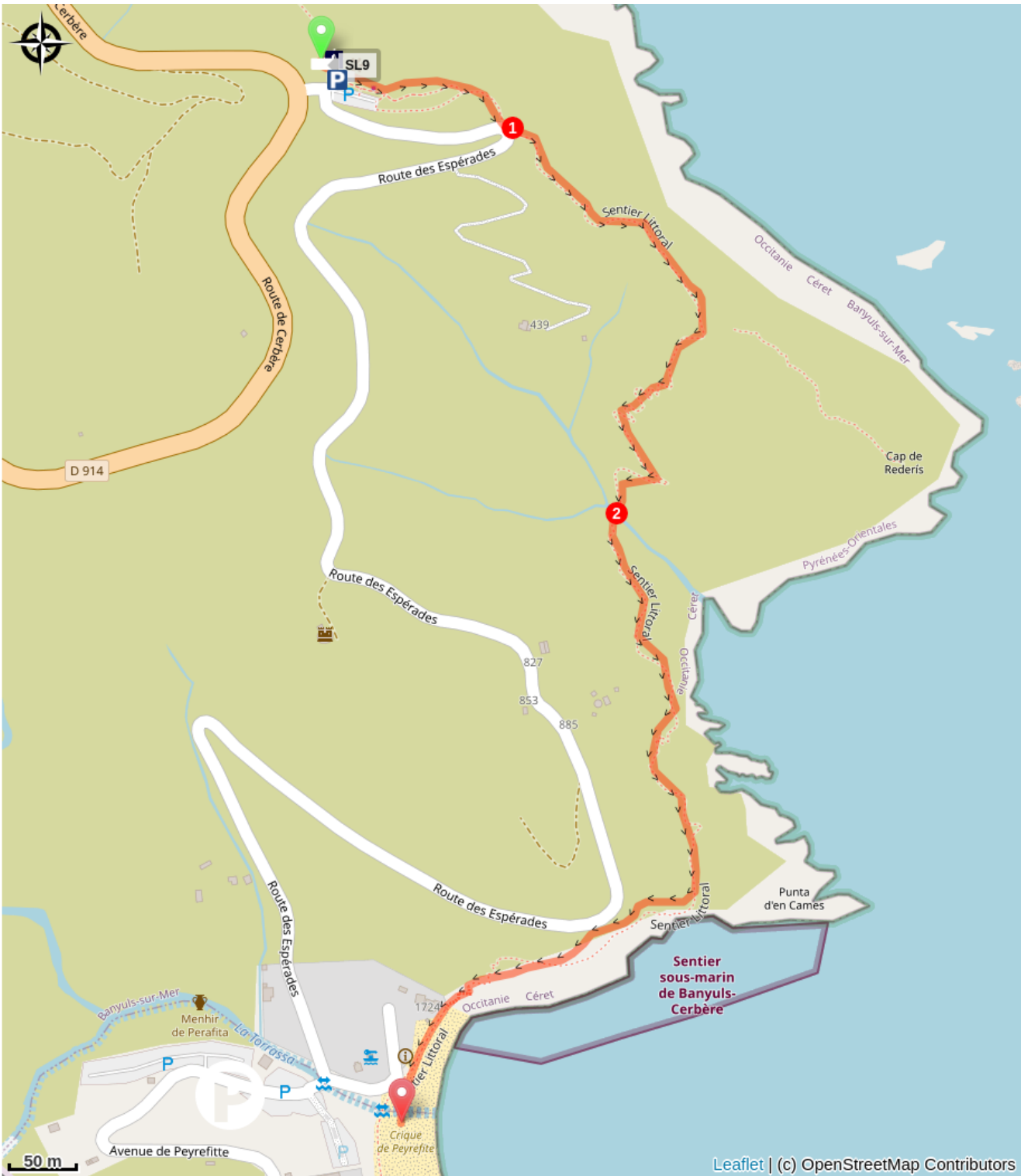
Table d'orientation du Cap Réderis (A)