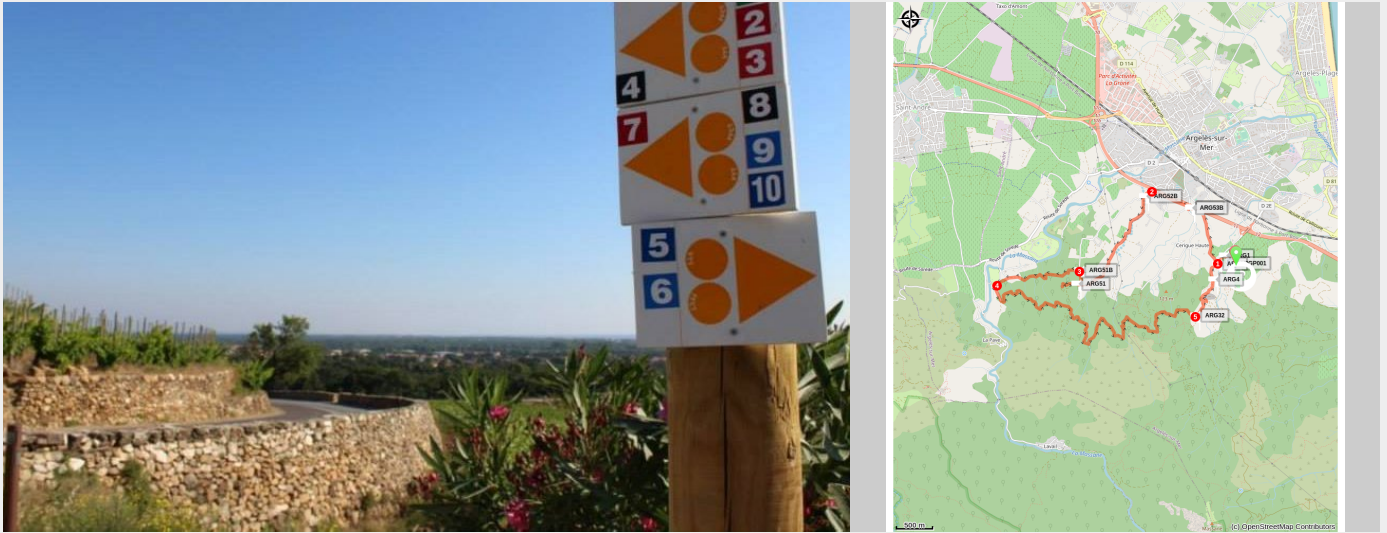
Signalétique VTT (Mairie d'Argelès-sur-Mer)