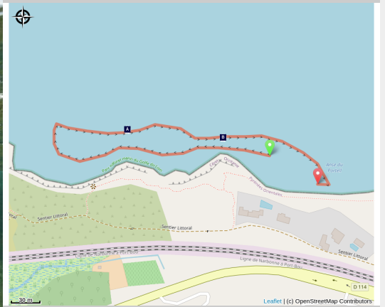
Randonnée palmée (Nostra Mar)