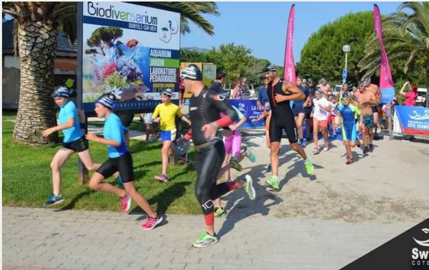
SwimRun La Kids (SwimRun France - Côte Vermeille)