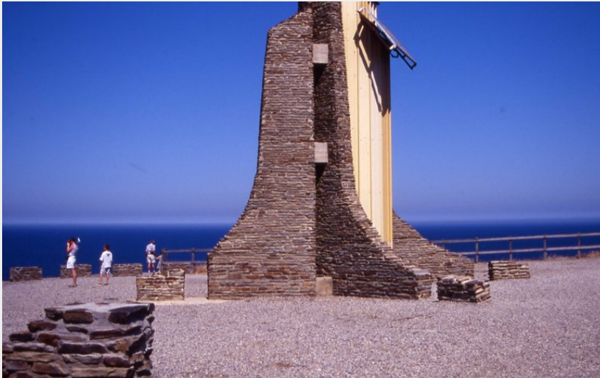
Phare du Cap cerbère