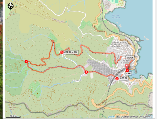
sentier des perdreaux (BIT Cerbère)

L'emprise de la gare internationale sur le village vue des hauteurs de Cerbère.