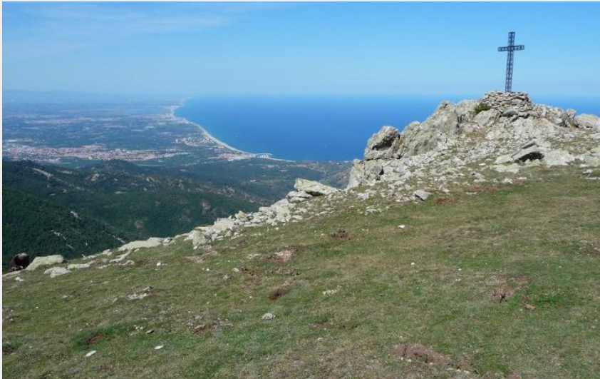
Pic Sallfort (elcoste)