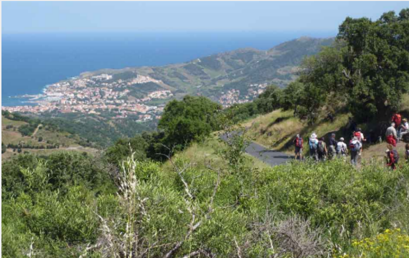
col des gascons (elcoste)