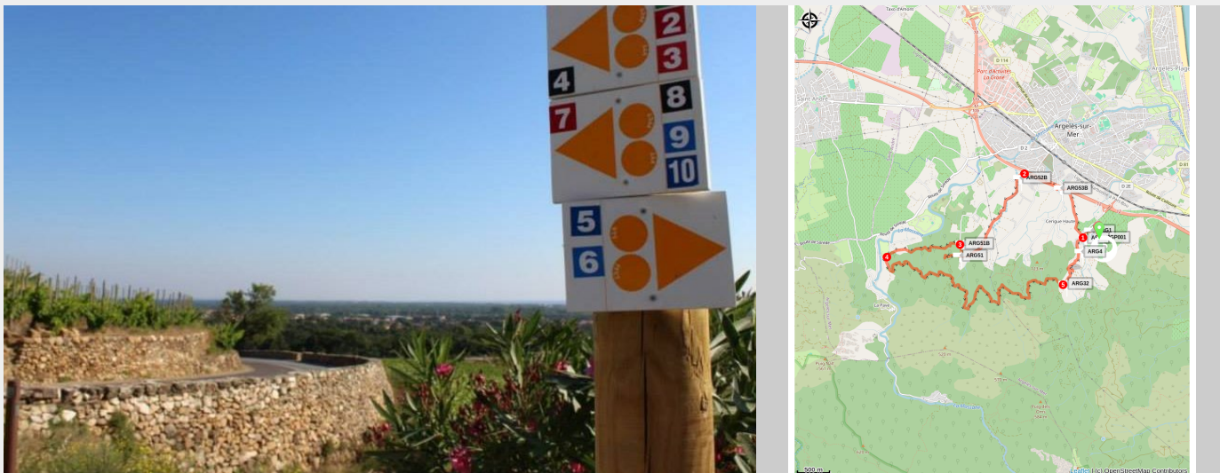
Signalétique VTT (Mairie d'Argelès-sur-Mer)